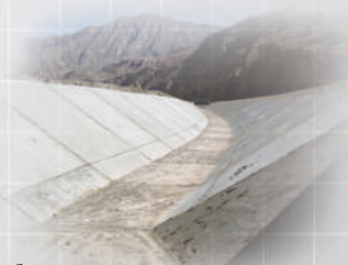
کانال انتقال آب سیمین دشت به گرمسار

پاوان شرکت ساختمانی (سهامی خاص) PAVAN construction co.