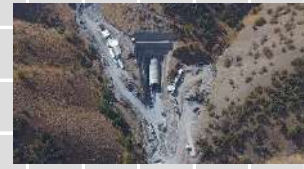
قطعه ۵ تیژ تیژ - گاران و تونل باغان - مریوان

پاوان شرکت ساختمانی (سهامی خاص) PAVAN construction co.